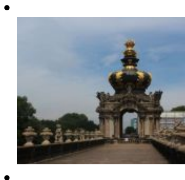
Bild Impressionen Weinerlebnisland Sachsen

Hier Anfrage nach Verfügbarkeit stellen.