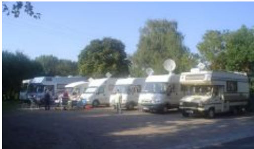
Stellplatz am Landhaus Nassau